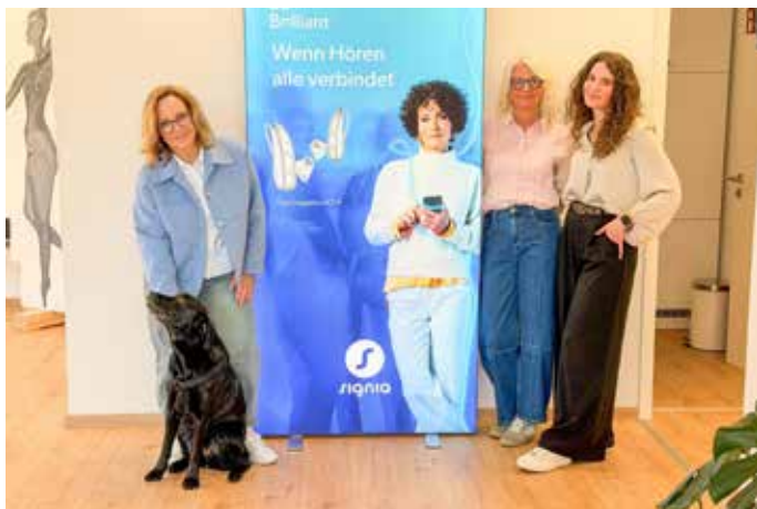
Das Team mit der vierbeinigen Unterstützung

DIE BRILLE profitieren Kundinnen und Kunden aktuell von attraktiven Vorteilen. Die laufende 2-für-1-Brillenaktion bietet beim Kauf einer neuen Brille mit ZEISS Markengläsern eine Sonnenbrille in Sehstärke kostenlos dazu. Damit verbindet das Fachgeschäft modische Vielfalt, hochwertige Glas-Technologie