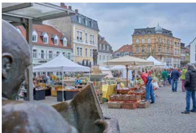
Blick auf den Marktplatz