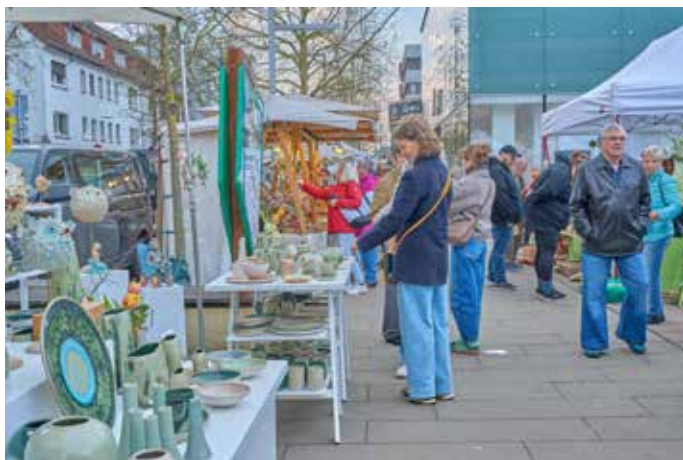
Flanierende Marktbesucher überall in der Stadt