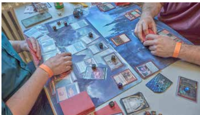
Seit den 1990ern auf dem Markt: „Magic the Gathering“ das allererste Trading Card Game seiner Art!