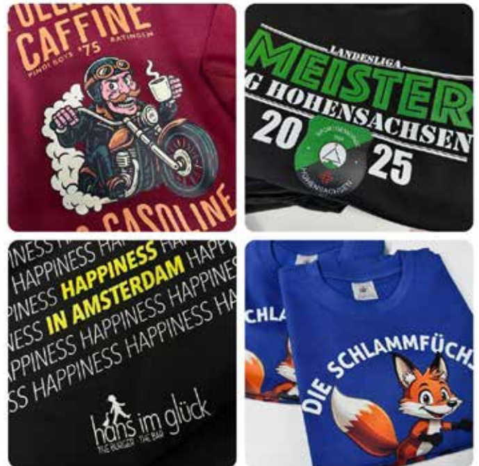
Individuelle Gestaltung Ihrer Shirts mit der Unterstützung von den Druckprofis