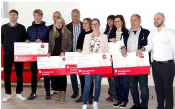
Gehrt wurden auch die betreuenden Lehrerinnen und Lehrer der verschiedenen Schulen

Erfahrungen und Strategien im Anschluss rege austauschten. Ein besonderer Anreiz für Schulen: Alle Schulen, die mindestens fünf qualifizierte Depots in der Wettbewerbsrunde platziert hatten, erhielten eine Spende in Höhe von 100,00 Euro. Dies unterstreicht das Engagement der Kreissparkasse