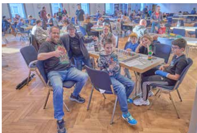
Spielgruppe: „Hero Quest“ - DER Klassiker mit vielen Jung-Fans hier und einem stolzen Vater