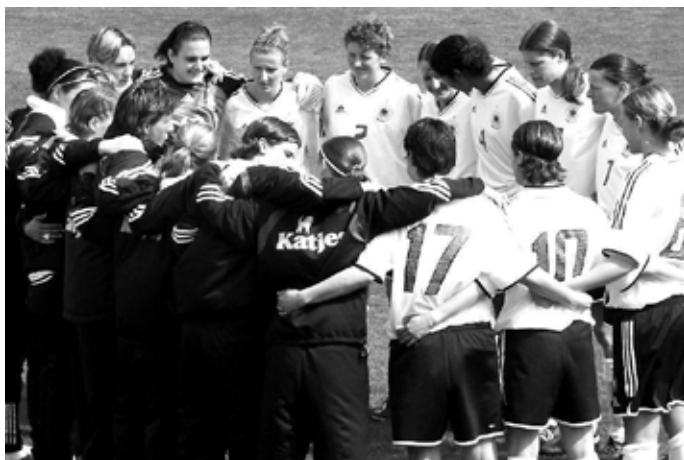
Das Team der deutschen Frauen-Fußball-Nationalmannschaft vor dem Spiel im Waldstadion