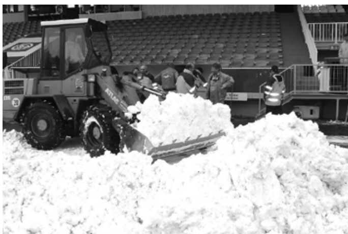
Ein später, plötzlicher Wintereinbruch sorgte für jede Menge Schnee im Waldstadion

und städtische Mitarbeiter im Waldstadion den Schnee von der Rasenfläche und von den Rängen geräumt, damit das Spiel überhaupt stattfinden konnte. Die wohl bekannteste Spielerin des deutschen Aufgebots war Steffi Jones. Nach ihrer Karriere war sie u.a. Präsidentin des Organisationskomitees für die Frauenfußball-Weltmeisterschaft 2011 und danach bis 2015 Direktorin beim Deutschen Fußball-Verband. Von 2016