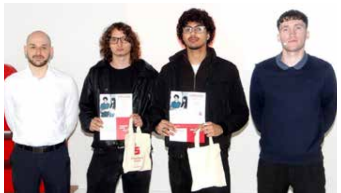
Das Team „Einhundert“ von der Paul-Weber Schule Homburg erreichte den ersten Platz in der Depotgesamtwertung