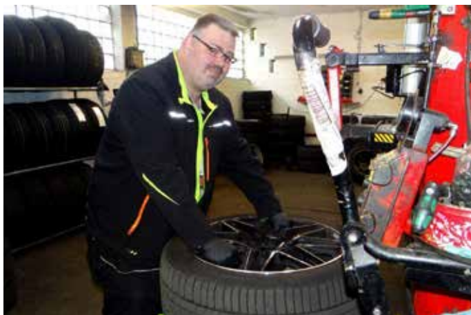
Wenn Räder richtig ausgewuchtet sind erhöht das die Lenkpräzision und mindert den Reifenverschleiß

Serviceportfolio ist eine moderne Räderwäsche: Mit einer speziellen Maschine werden Reifen und Felgen gründlich und schonend gereinigt, denn Bremsstaub und Streusalz können mit der Zeit häufig zu Lackschäden und Korrosion an Rädern