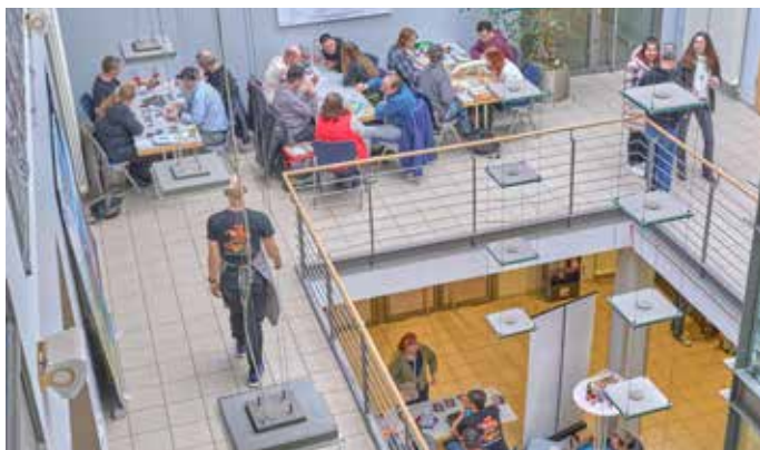
Der Saalbau war zwei Tage lang auf allen Etagen eine riesige Spieleoase