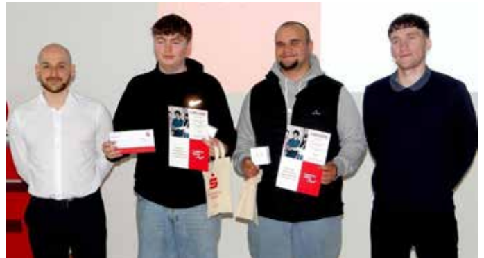
Das Team „Rainer Winkler“ von der Schule an den Linden in Limbach erreichte den ersten Platz in der Nachhaltigkeitswertung

Depotgesamtwertung mit einem beeindruckenden Depotwert von 59.107,27 Euro! Beim Nachhaltigkeitswettbewerb erreichte das Team „Rainer Winkler“ von der Schule an den Linden in Limbach den ersten Platz mit einem Nachhaltigkeitswert von 5.343,85 Euro. Beide Gewinnerteams waren auch saarlandweit