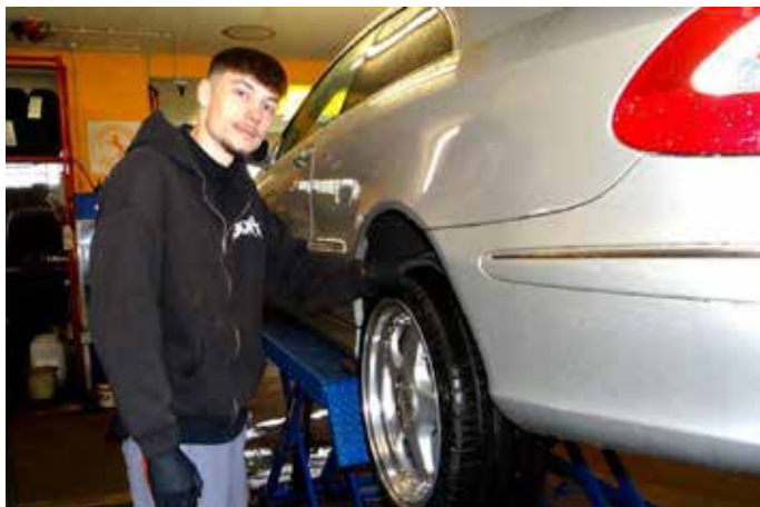
Großen Wert legt man bei Reifen Hunsicker auf eine fachgerechte Reifenmontage