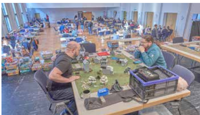
„Tabeltops en masse“ bei der 9. Auflage der CON des Gastgebers Gedankenwelten e.V. Homburg