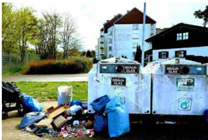
Auch rund um den die benachbarten Glascontainer wird offensichtlich „wild“ abgelagert

Genau dieses Szenario bietet sich derzeit auch an einem Standort in unmittelbarer Nähe des Homburger Aldi-