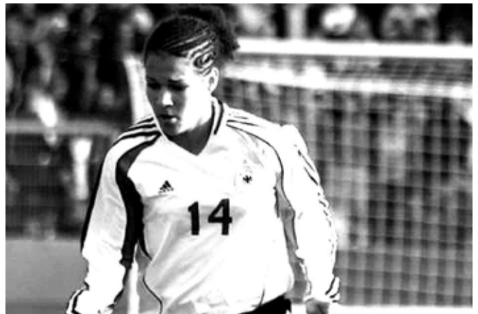
Die wohl bekannteste Spielerin des deutschen Teams war Steffi Jones

„Erinnern Sie sich noch?“ – Diese Frage haben wir uns alle schon das eine oder andere Mal gestellt, wenn uns ein Bild, ein Geruch oder ein vertrautes Geräusch in die Vergangenheit zurückversetzt. Unsere neue Rubrik lädt dazu ein, genau das zu tun: in Erinnerungen schwelgen und gemeinsam mit uns einen Blick auf die Vergangenheit unserer Stadt werfen. Gelegentlich präsentieren wir Ihnen ein historisches Foto, das einen besonderen Moment aus der Geschichte unserer Stadt festhält. Es sind Bilder, die uns an prägende Ereignisse, kleine Alltagsgeschichten oder große Veränderungen erinnern, die die Stadt damals, und auch uns, geprägt haben. Manche Fotos mögen längst vergessene Geschichten erzählen, andere wiederum wecken lebendige Erinnerungen an vergangene Zeiten. Wir freuen uns darauf, mit Ihnen, liebe Leserinnen und Leser, auf eine visuelle Zeitreise zu gehen. Sind Sie dabei? Dann lassen Sie uns gemeinsam in die Vergangenheit eintauchen und entdecken, was diese Bilder uns noch heute zu sagen haben.