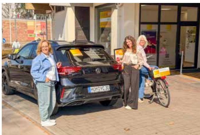
Hörgeräte Collet & Siffrin ist mit Fahrrad und KFZ mobil