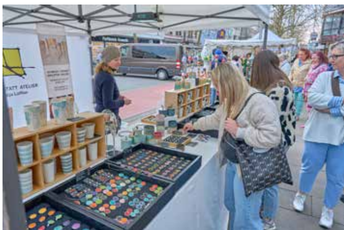
Keramikschmuck aus Augsburg gab es hier zu kaufen

Lächeln an diesem schönen Tag verbleibt das gute Gefühl, dass Homburg nach dem Winter jetzt wieder auflebt.