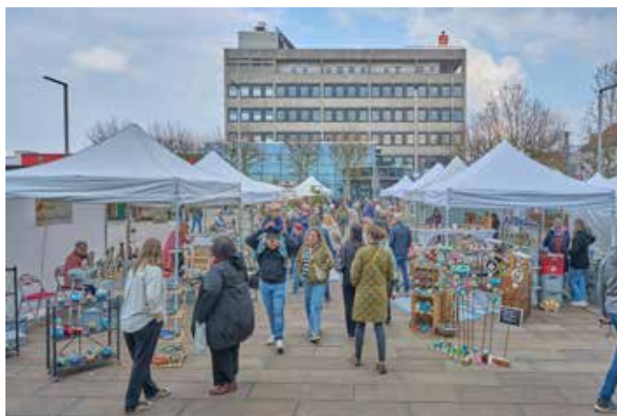
Der Keramikmarkt 2026 auf dem Christian-Weber-Platz