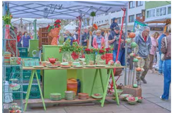
Ausschnitt vom Keramikmarkt 2026 auf dem Christian-Weber-Platz