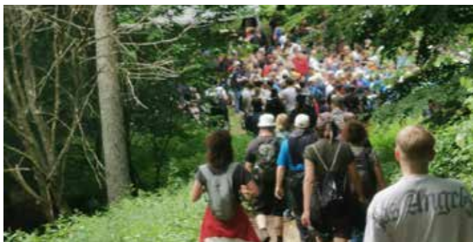
Am 14. Mai findet die 7. Homburger Bierwanderung statt

Es gibt also neben dem Start und Ziel noch weitere sechs Verpflegungsstationen, fünf davon mit Live-Musik, Bier vom Fass sowie sonstigen Getränken und unterschiedlichen Speiseangeboten. Eine zusätzliche alkoholfreie Versorgungsstation mit Süßem und Kaffee kommt dazu. Die gesamte Strecke wird wie immer genau ausgeschildert sein. Jede Station hat neben der Premiumsorte UrPils eine weitere spezielle Biersorte aus dem Hause Karlsberg zu Vorzugspreisen im Programm. Selbstverständlich sind auch alkoholfreie