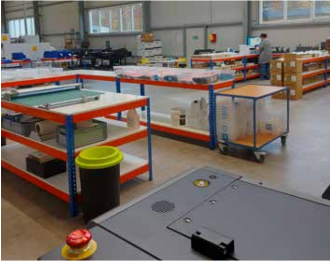
In der großen Halle befindet sich die Produktion

24 Stunden realisieren, ideal für Events, Unternehmen oder kurzfristige Aktionen. Das Sortiment reicht weit über T-Shirts hinaus: Hoodies, Arbeitskleidung, Jacken, Polo-Shirts, Pullover