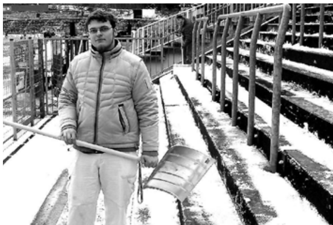
Ca. 80 Freiwillige und städtische Mitarbeiter räumten den Schnee vom Rasen und von den Rängen