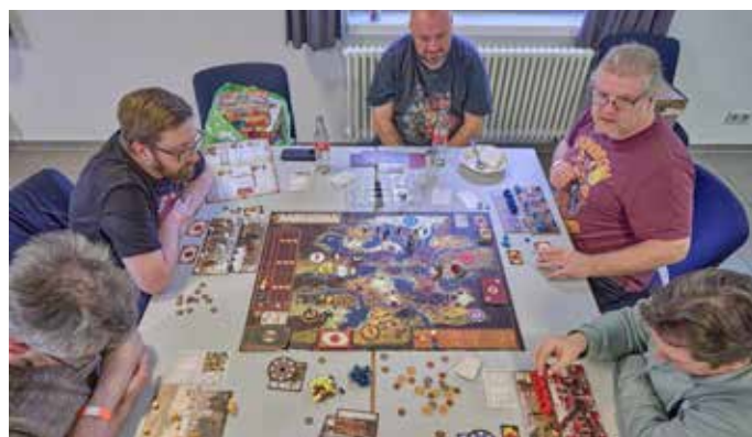
„Scythe“-Spielgruppe. Das strategische Spiel mit starken Aufbauelementen gibt Spielern nahezu vollständige Kontrolle über ihr Schicksal

Auswahl aus!“ M: „Ich bin der Martin“, sagt er. „Ja, wir haben hier unsere Spieleausleihe dabei. Das sind so um die 300 bis 400 Spiele, die wir hier für die Besucher der CON bereitstellen. Das Prinzip ist ganz einfach: Man kommt vorbei, sucht sich was aus, wir erklären es bei Bedarf auch kurz, und dann kann man sich an einen der Tische setzen und direkt losspielen.“ Unser Reporter hakt nach: „Und was sind so die Renner dieses Jahr? Gibt es irgendwas, was ständig weg ist?“ M: „Das ist ganz unterschiedlich. „Klassiker wie „Die Siedler von Catan“ oder „Carcassonne“ gehen natürlich immer, aber auch viele neue