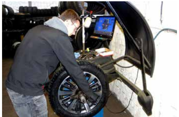
Dank modernster Maschinen ist man bei allen Reifenproblemen bei Reifen Hunsicker an der richtigen Adresse. Für alles gibt es eine fachgerechte Lösung

und der technisch korrekte Einsatz von Drehmomentschlüsseln. Denn nur zufriedene Kunden werden Stammkunden. Geboten wird auch eine sichere Reifeneinlagerung. „Um die Lebensdauer der Reifen zu optimieren, lagern wir diese fachgerecht: kühl, lichtgeschützt und an einem trockenen und sauberen Ort“, erzählte uns Ralf Hunsicker bei unserem Besuch in der