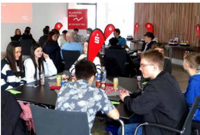
Die erfolgreichsten Schülerinnen und Schüler beim Planspiel Börse 2025 waren zur feierlichen Siegerehrung in das neue Veranstaltungsgebäude der KSK Saarpfalz eingeladen

Saarpfalz, nicht nur die besten Börsianer zu belohnen, sondern auch die Schulen, die die nächste Generation von Finanzexperten fördern. Das Planspiel Börse bietet nicht nur einen spielerischen Zugang zu den Finanzmärkten, sondern vermittelt auch wichtiges Wissen, das im späteren Leben von