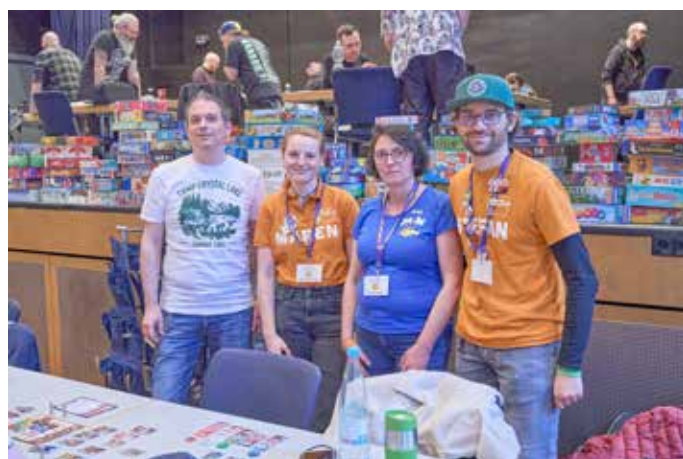
Ein Teil der Helfer-, Orga- und Verlagsteilnehmer „Spieleoase“ und „Lookout Games“ zu Gast beim Gedankenwelten e.V. Homburg