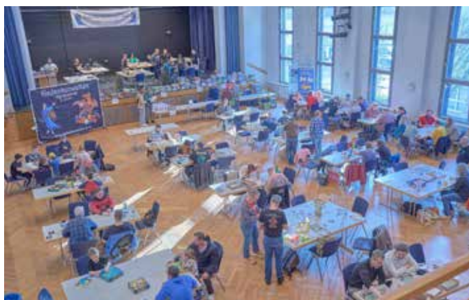
Der große Saal bei der „CON 9“ 2026 von der Galerie aus fotografiert

Ausrichter war erneut der Homburger Spielverein „Gedankenwelten e.V.“, den es schon seit 1993 gibt. In Zusammenarbeit mit dem JOSH-Büro der Stadt Homburg